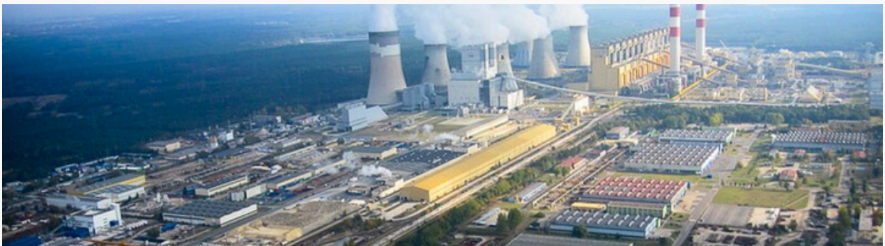
Elektrownia Bełchatów

Wszystkie trzy węzły mają wciąż potencjał przyciągania inwestorów , co stanowi naturalną szansę dla tworzenia miejsc pracy również dla osób powiązanych z koncernem energetycznym w Bełchatowie.