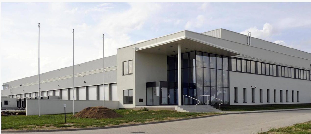
Frigo Logistics, Radomsko

Ze względu na branżę, część zakładów szczyt zatrudnienia odnotowuje w sezonie letnim (mroźnia Frigologistics, PressGlass, branża budowlana). Liczba osób pracujących jest szacunkowa i powstała na podstawie wywiadów, ze względu na brak obowiązku zgłaszania takich danych do samorządu.