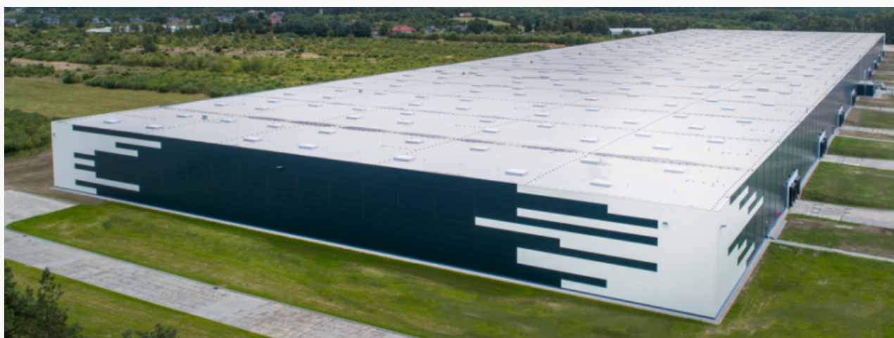
Centrum Dystrybucji JYSK w Radomsku

W Radomsku już zainwestowali też: Whirlpool, VPK, Cortizo, PRT Radomsko, HSV, Union Industries, Cynkownia Radomsko, Logistyka24, Ardagh Metal Beverage Poland, Konstalex i wiele innych.