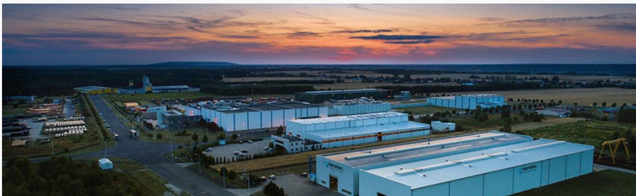
Kleszczowska Strefa Przemysłowa

Zakłady produkcyjne w Kleszczowskich Strefach Przemysłowych odgrywają coraz ważniejszą rolę w gospodarce gminy oraz regionu. Jest wśród nich szeroko reprezentowany kapitał zagraniczny.