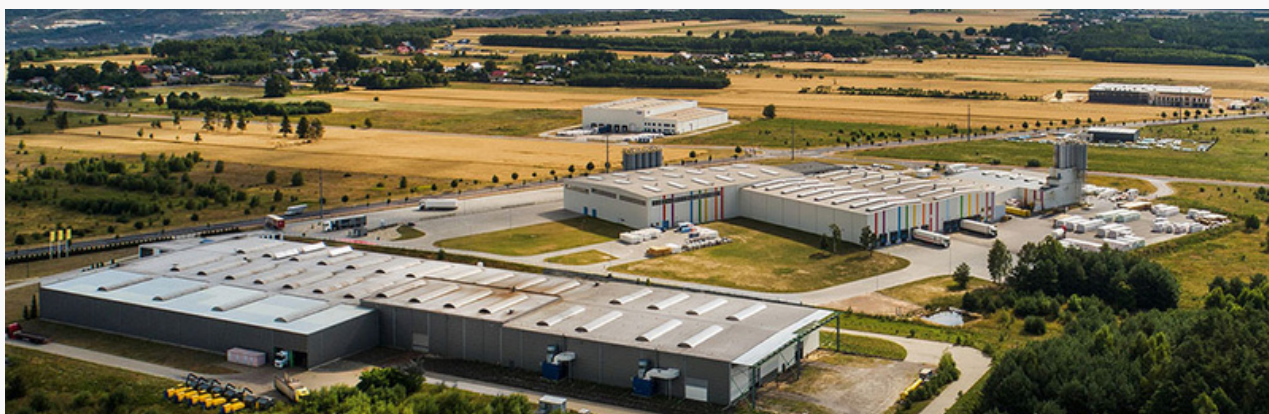
Kleszczowska Strefa Przemysłowa

Gmina Kleszczów położona jest w centralnej Polsce w południowej części województwa łódzkiego, w powiecie bełchatowskim, w pobliżu tras: Warszawa – Wrocław i Katowice- Gdańsk. Gmina liczy obecnie 6200 mieszkańców i słynie z ulokowania na jej terenie Kopalni Węgla Brunatnego Bełchatów oraz Elektrowni Bełchatów należących do Polskiej Grupy Energetycznej.