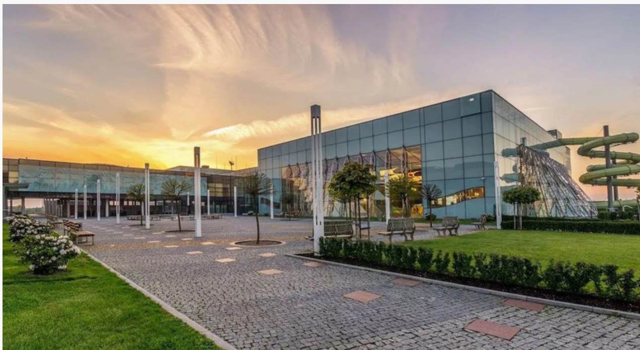
Solpark Kleszczów w gminie Kleszczów

Po zakończeniu działalności takie obiekty jak Solpark warto będzie utrzymać bez względu na wysokość wpływów do lokalnego budżetu.