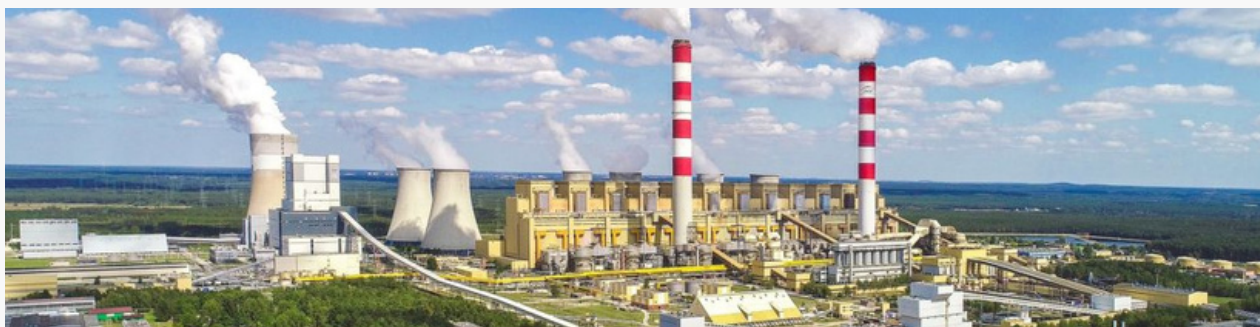
Kopalnia i elektrownia Bełchatów

Teren gminy przedzielony jest odkrywką (wkopem) wyrobiska Pola „Bełchatów”, co znacząco wpływa na strukturę i zagospodarowanie przestrzenne w gminie. Tereny górnicze zajmują ponad 1852 ha, a sama odkrywka ma wymiary 8 x 2,9 km, osiągając głębokość 291 m, a więc schodząc około 110 m poniżej poziomu morza. Na terenie gminy znajdują się też uciążliwe składowiska popiołu i żużla (powstaje około 4 miliony ton rocznie), czyli odpadów po węglu spalonym w elektrowni. Ponadto kopalnia osuszyła teren wokół odkrywki. Powstał lej depresyjny w wyniku którego efektywność rolnictwa jest bardzo niska.